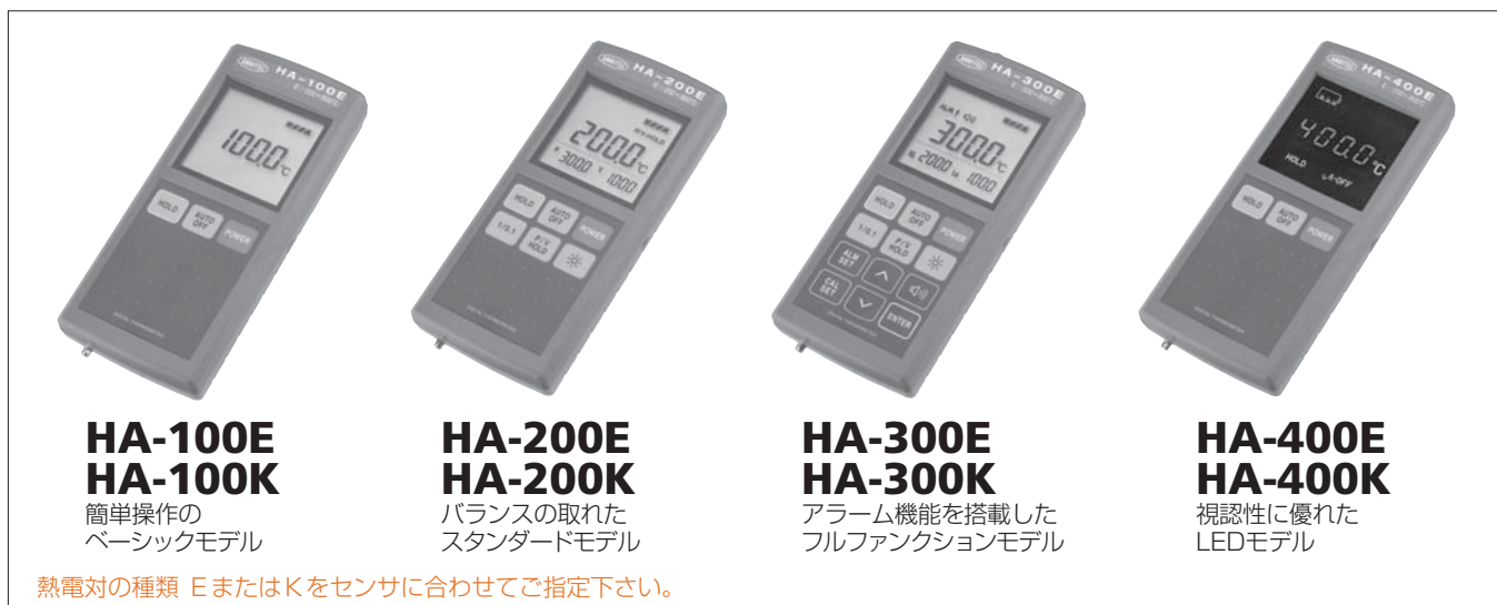
HA-100E HA-100K 簡単操作の ベーシックモデル